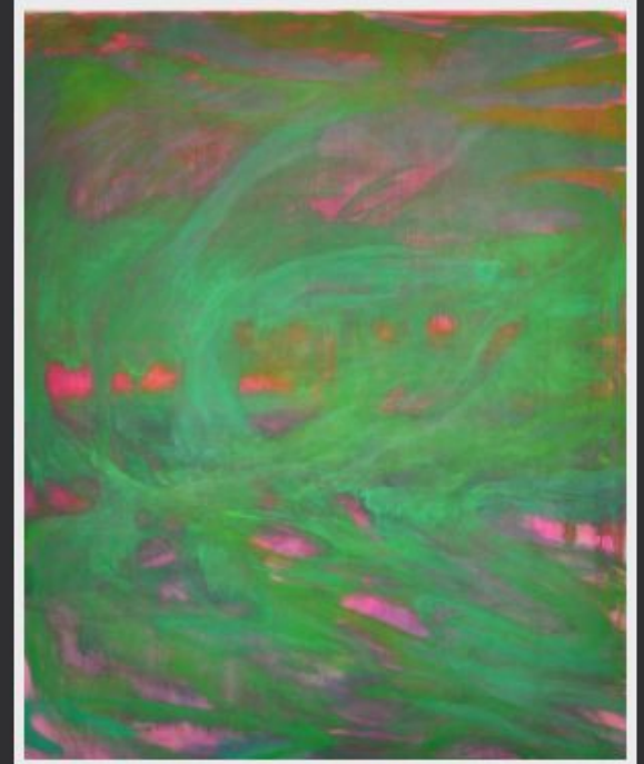
Augusta Lardy Micheli. El calor extremo se mezcla con la luz. 2022. Acuarela, yeso,acrílico y óleo sobre lino.